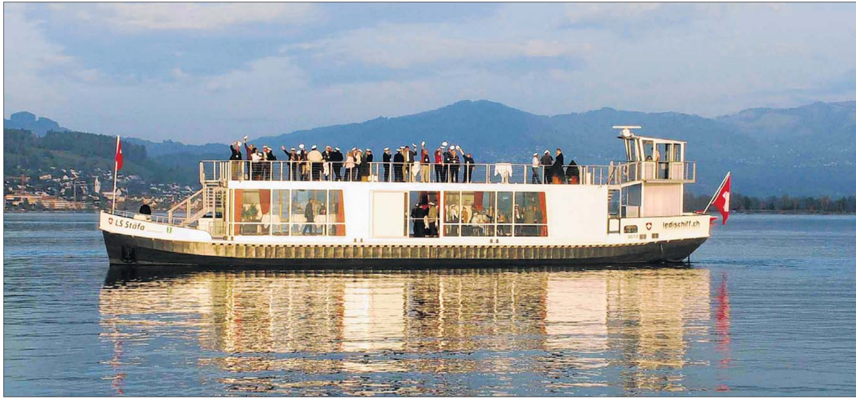
Das elegante Schiff gleitet jetzt in seiner ganzen Pracht auf dem Ober- und Zürichsee. Zum Gruss schwenken die ersten Passagiere ihre Kapitänsmützen.

Schmerikon Geladene Gäste feierten die Wiedergeburt eines Ledischiffs