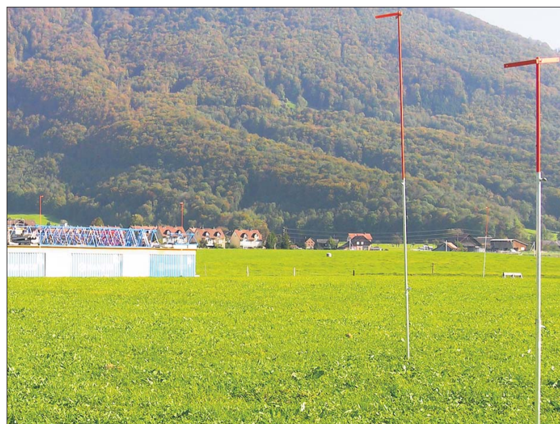
Hier im Schänner Säumerguet beginnt schon bald der Bau eines Aldi.